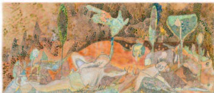
Hoher Mittag, August Aquarell, Tempera, Bleistift auf TH Saunders England Bütten, 1969 ca. 25,3 x 58,5 cm Wvz. 69/11 Privatbesitz, Warburg