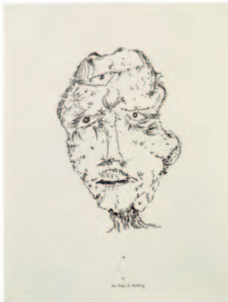
Das Wiehern der Zerstörung Lithografie auf Zeichenkarton, 1949 ca. 30,5 x 20 auf 50 x 37,5 cm Exemplar ohne Nummer Wvz. Janda L 6