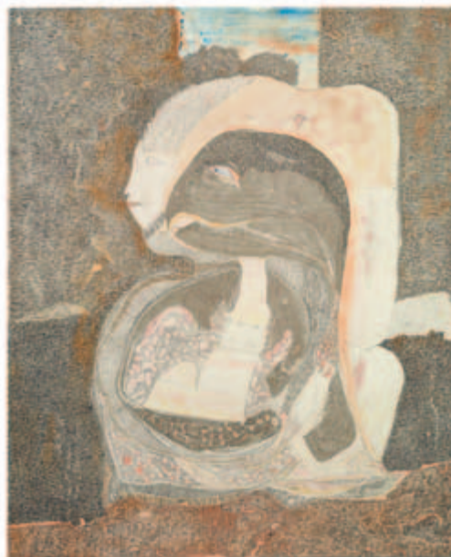
Sphinx Mischtechnik, 1969/78 49,2 x 40 cm Wvz. 78/81