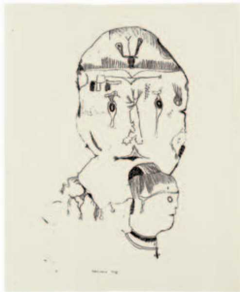
Römischer Kopf Lithografie auf Altdeutsch Bütten, 1950 ca. 42 x 24 auf 51 x 47,5 cm Exemplar ohne Nummer Wvz. Janda L 39