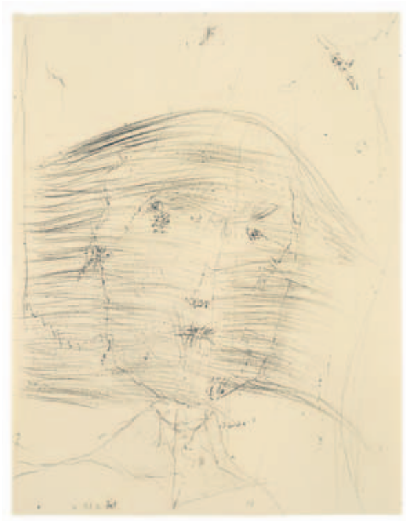
Im Fluß der Zeit Pitt-Kreide, Bleistift auf gelblichem Canson France Ingres Bütten, 1962 64,5 x 50,2 cm Wvz. 62/25 Sammlung H. und D.B.