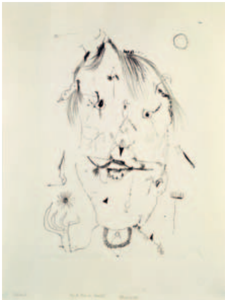
Aber die Blume der Romantik Lithografie auf Zeichenkarton, 1949 38,5 x 25 auf 50 x 37,5 cm Probedruck Wvz. Janda L 11