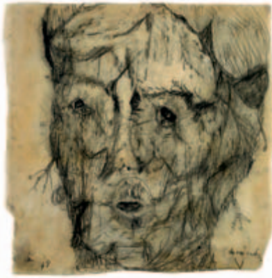
Schreiender Pitt-Kreide auf zerknittertem Transparentpapier, 1949 ca. 29 x 29 cm Wvz. 49/60