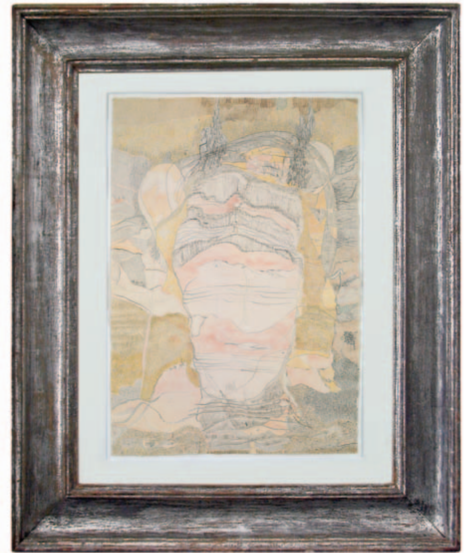
Du, einmal hinweggeweht Bleistift, Aquarell, Tempera, Chinesische Tusche, Pastell auf Bütten, 1972 59,5 x 42 cm Wvz. 72/20