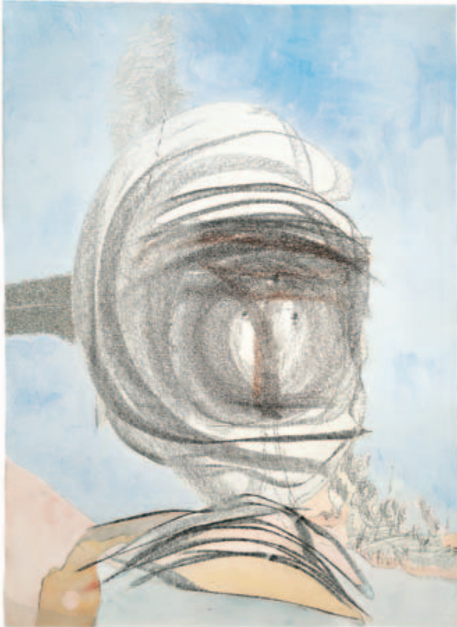
in sich, außer sich: schwebende Rast Gouache, Pulverfarbe, Aquarell, Litho-Kreide, Bleistift, Rötzel, Wachsmalkreiden, Chinesische Tusche auf Fabriano Roma Bütten, 1982 77,8 x 56,5 cm Wvz. 82/34