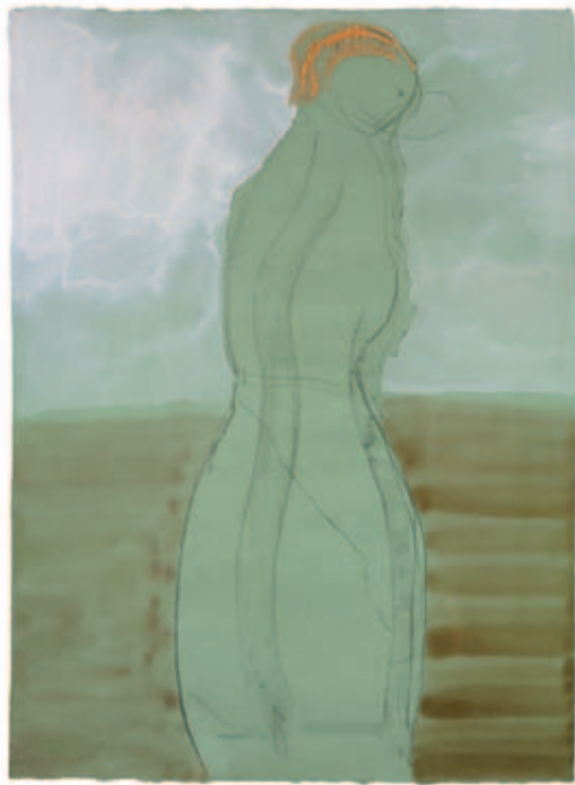
Raumlockend; über die Fluren hin Kasein-Wachseife-Tempera, Gouache, Pastell, Pitt-Kreide, Aquarell und Chinesische Tusche auf Fabriano Roma Bütten Veronese, 1981 67,2 x 49 cm Wvz. 81/15