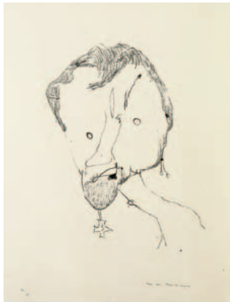
Aber der Pour le mérite Lithografie auf Zeichenkarton, 1949 ca. 36 x 26,5 auf 52 x 37,6 cm Exemplar ohne Nummer Wvz. Janda L 10