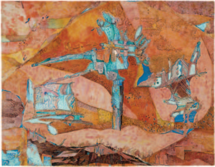
Quellender Schöpfungstag Aquarell, Litho-Kreide, Chinesische Tusche auf Altdeutsch Bütten, 1953 48,3 x 62,4 cm Wvz. 53/18