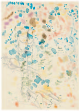
ohne Titel Arbeitsblatt mit mehreren Figuren Bleistift, Pinselabstreifungen auf Zeichenkarton, ohne Jahr 29,8 x 21 cm Wvz. 90/N 502