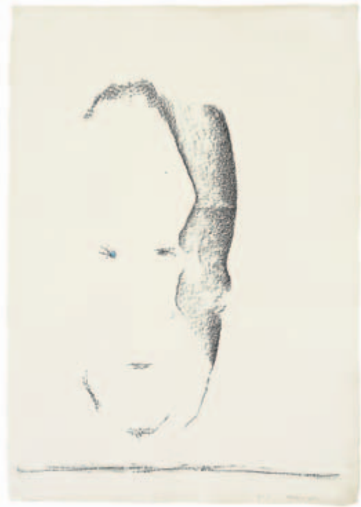
Sprich im Schweigen – sprich – Pitt-Kreide, Graphit, Pastell auf Bütten, 1989 60 x 42,5 cm Wvz. 89/8