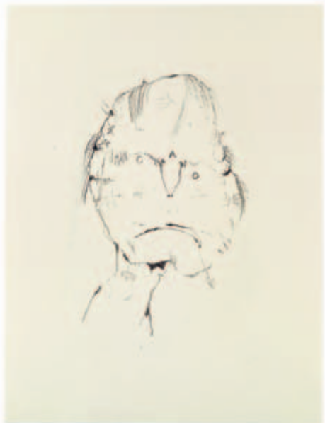
Maulkniff Lithografie auf Zeichenkarton, 1949 ca. 31,5 x 20 auf 50 x 37,5 cm Exemplar ohne Nummer Wvz. Janda L 8