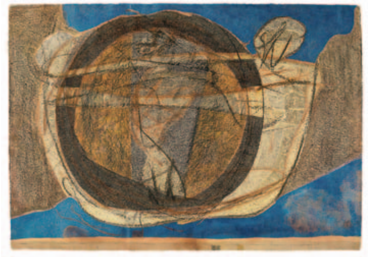
Nirgends ein Ausbruch möglich Im Labyrinth / Im Rad Gouache, Aquarell, Rötél, Bister, Chinesische Tusche, Kreide auf Velin Bütten, 1965 41,5 x 59,5 cm Wvz. 65/4