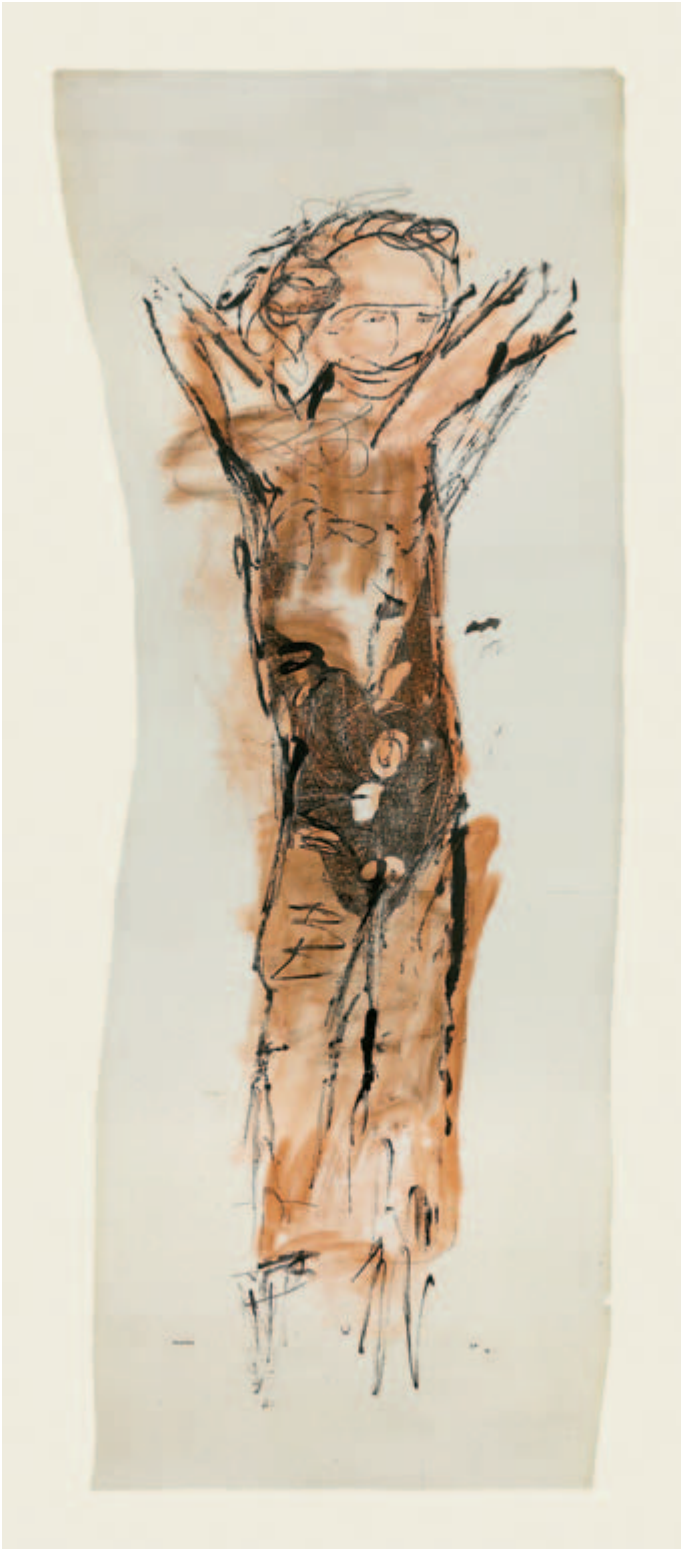
Knabentorso Chinesische Tusche, Rötöl auf Papier, 1956 ca. 158 x 55 cm Wvz. 56/45