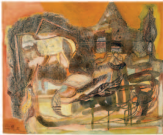
Hund in der Landschaft Aquarell auf Kanzleibütten, 1955 38 x 46 cm Wvz. 55/53 Sammlung H. und D.B.