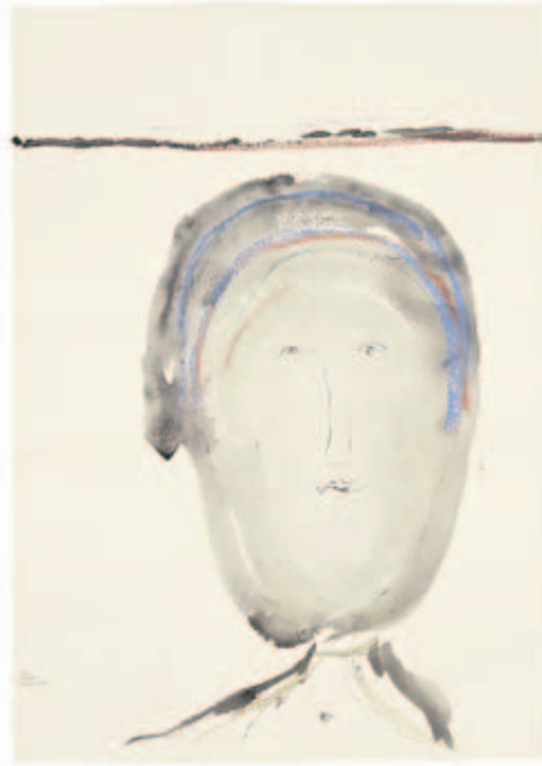
Der Brache Senken=Blick Chinesische Tusche, Pastell, Pitt-Kreide, Litho-Kreide, Bleistift auf Bütten, 1989 59,8 x 42 cm Wvz. 89/14