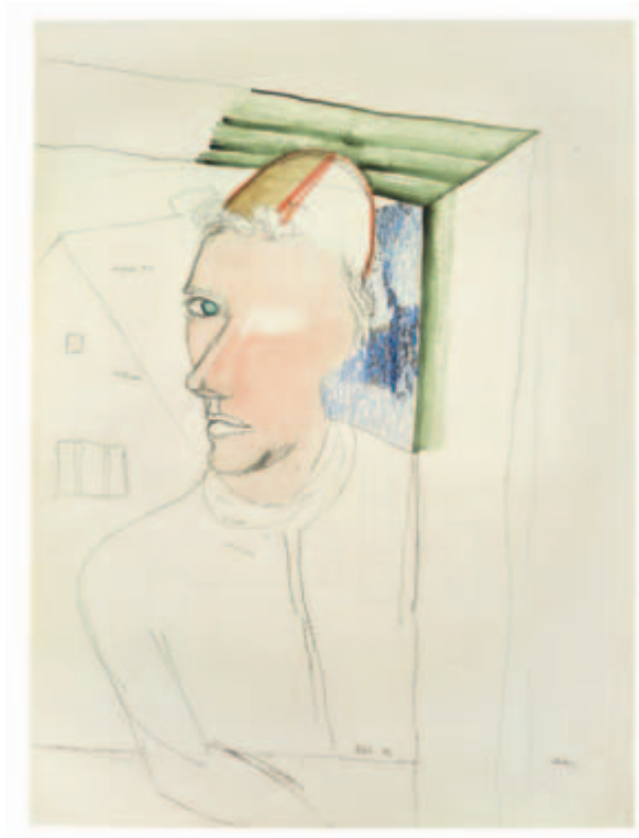
Selbst 1947 Pitt-Kreide, Aquarell auf Schoellershammer Karton, 1947 69,1 x 51,2 cm Wvz. 47/11 Privatsammlung, Berlin